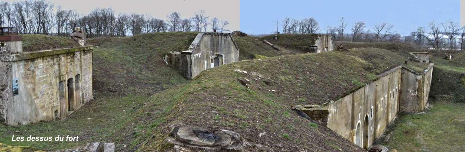
Les dessus du fort