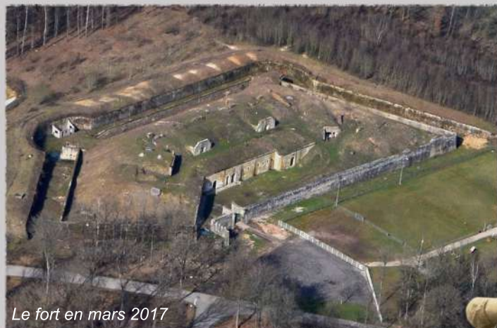
Le fort en mars 2017

Il possédait un armement à l'air libre qui contrôlait un secteur allant de la côte de Virine au ravin de Thaon et il soutenait ses voisins, les forts de Dogneville, de Bois l'Abbé et d'Uxegney.