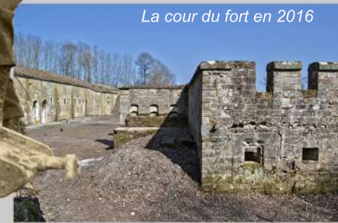
La cour du fort en 2016