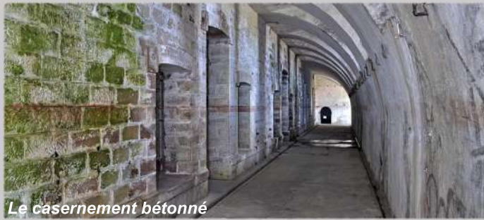
Le casernement bétonné