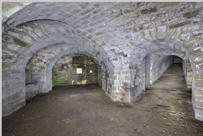
La caponnière double

Vous partirez à l'assaut de cette fortification pour découvrir son histoire, son architecture particulière (escalier atypique, magasin à poudre, caponnières, logement de vie des soldats,...) et vous plongerez dans la vie militaire de la place forte d'Épinal en parcourant le fort et en découvrant différentes photos d'époque.