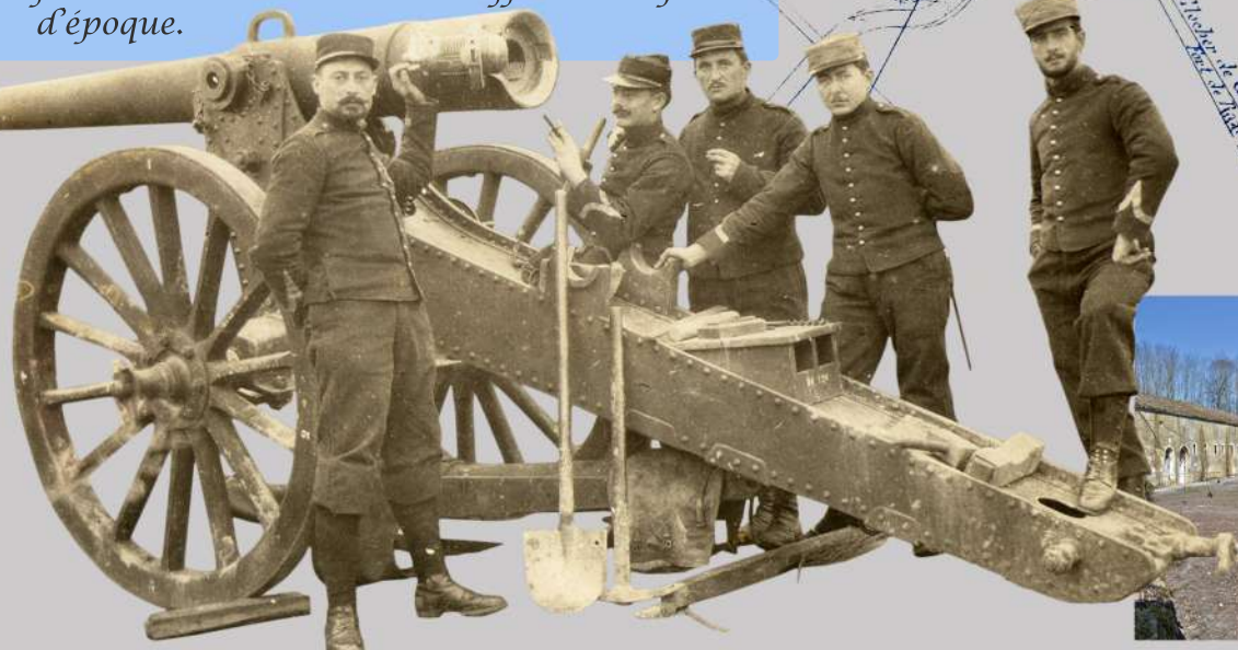
Une pièce de 120L mle 1878 sur une des batteries d'artillerie de la Justice à Épinal vers 1906