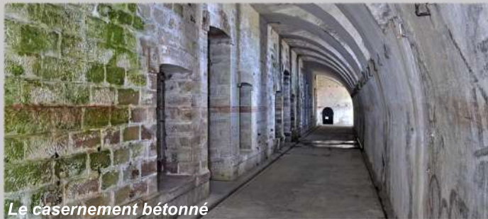
Le casernement bétonné