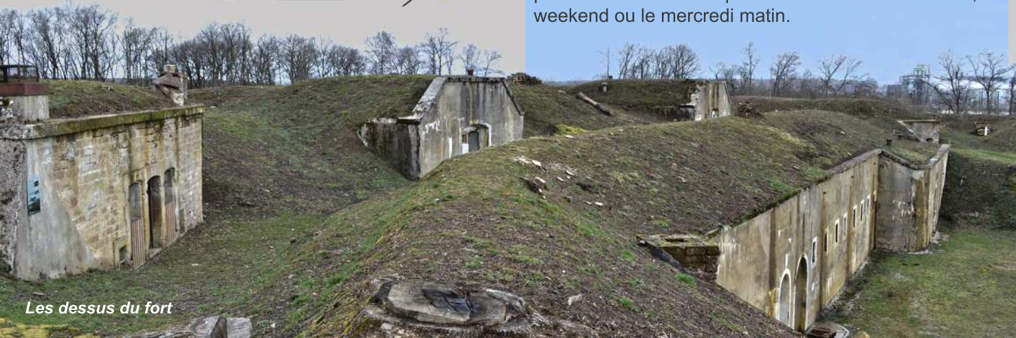
Les dessus du fort

Visites guidées le 2ème dimanche de chaque mois d'avril à septembre