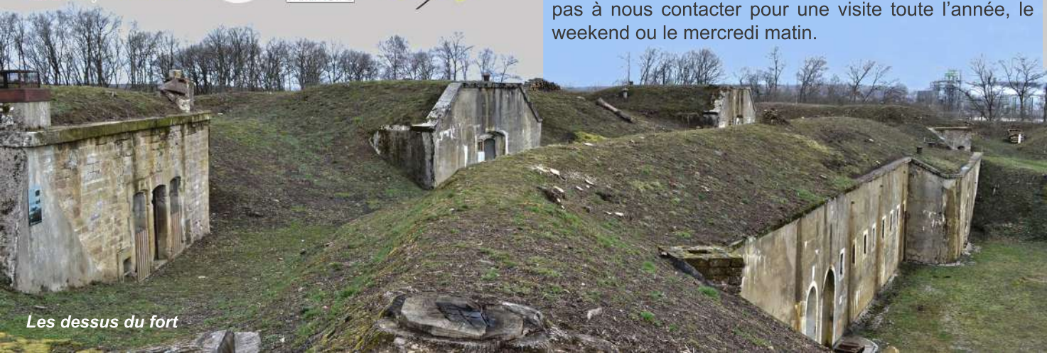
Les dessus du fort

Visites guidées le 2ème dimanche de chaque mois d'avril à septembre