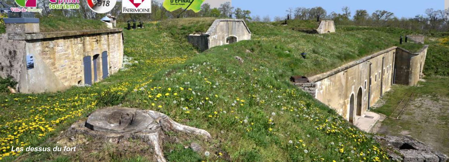
Les dessus du fort

Vous êtes un groupe de plus de 10 personnes, n'hésitez pas à nous contacter pour une visite toute l'année, le weekend ou le mercredi matin.