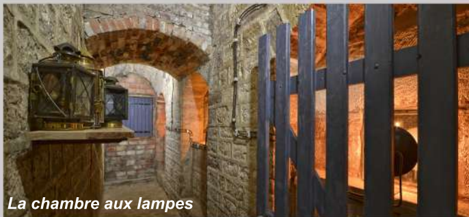
La chambre aux lampes