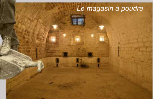
Le magasin à poudre