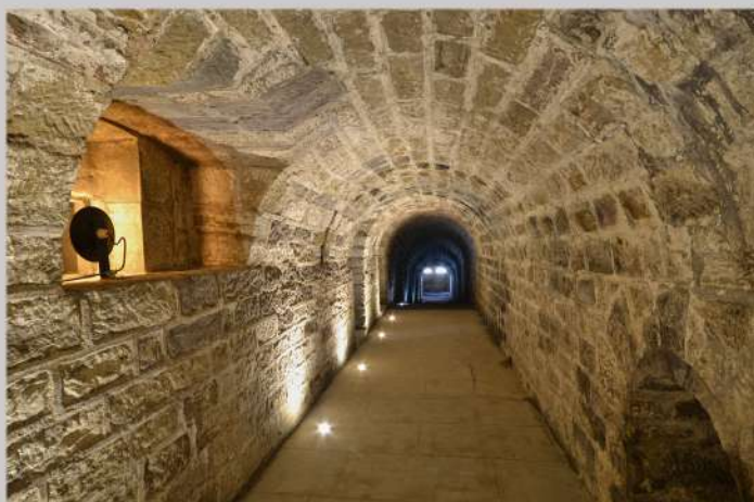
La galerie menant à la caponnière double

Vous partirez à l'assaut de cette fortification pour découvrir son histoire, son architecture particulière (escalier atypique, magasin à poudre, caponnières, logement de vie des soldats,...) et vous plongerez dans la vie militaire de la place forte d'Épinal en parcourant le fort et en découvrant différentes photos d'époque.