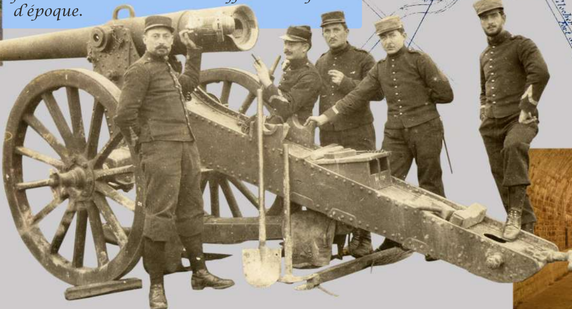
Une pièce de 120L mle 1878 sur une des batteries d'artillerie de la Justice à Épinal vers 1906

Propriété de la commune de Golbey, le fort est restauré depuis 2015 par les bénévoles de Fortiff'Séré – l'association Séré de Rivières. Ce travail de restauration, dont les premiers travaux ont permis de dégager entièrement l'ouvrage, a attiré l'attention de la Fondation du Patrimoine.